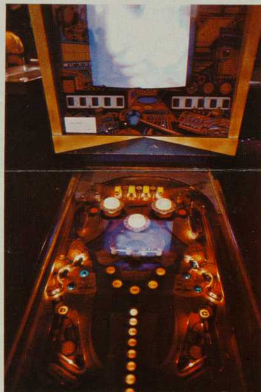
il y a plus de trente ans maintenant, Marcel Duchamp. Mais en haut un film audiovisuel nous renvoie l'image du joueur qui n'est pas face à la machine mais dans la machine. Constatation grâce à la caméra vidéo, amplification des sensations et des pulsions grâce au synthétiseur qui transforme les couleurs et les formes. Tous les flippers en un.