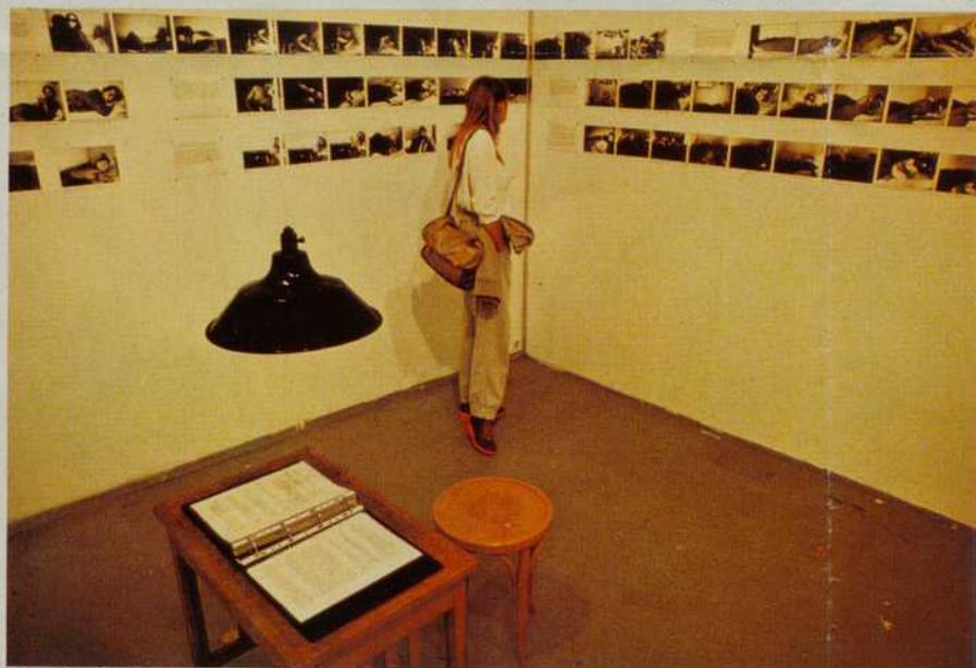
Sophie Calle (France), décide de provoquer des situations arbitraires. Elle fait se succéder dans son lit, pour y dormir 8 heures chacune, 32 personnes non-stop. Elle les interviewe, les photographie systématiquement avec une maniaquerie d'entomologiste ou de fonctionnaire et consigne le tout grâce à un registre et une série de photos.