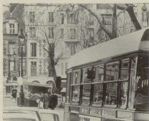
A gauche : Malaval (Galerie Daniel Gervis), ci-dessus : Tibor Csernus (Galerie Claude Bernard).