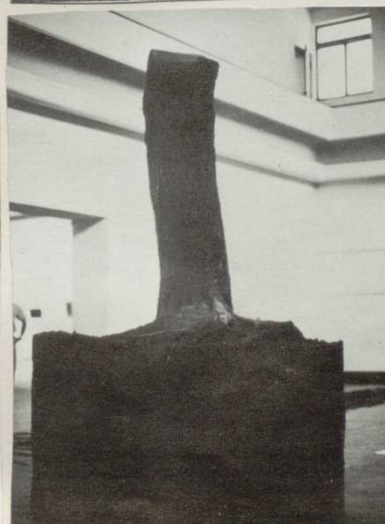
Le Terme Corporel. 1971. Tronc d'arbre, terre