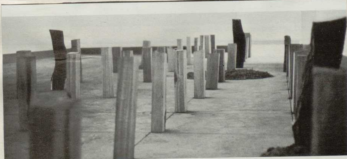
Corps. 1971. Arbre et terre