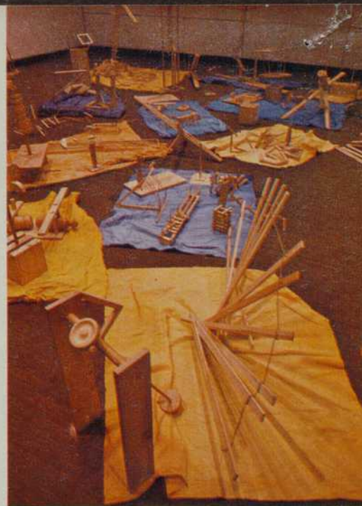
Paisaje imaginario (Espagne). A la fois le titre de l'œuvre et le nom du groupe, Paisaje imaginario est un lieu de « conversation sculpturale ».