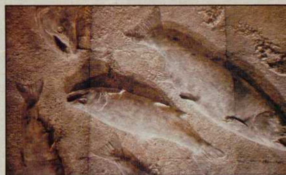
Poissons pris dans une gangue de plâtre pour un bas-relief monumental et écologique.