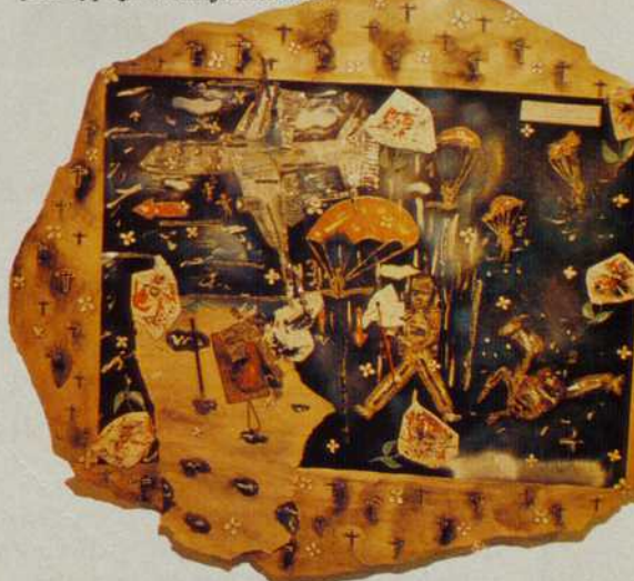
Ralf Johannes (R.F.A.). Sept papiers peints qui racontent la vie de sept cadavres. Une renaissance certaine de l'expressionnisme allemand.