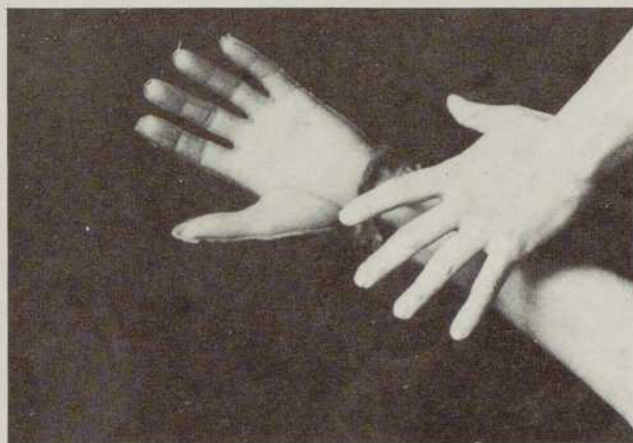
Extrait du film de Michel Nedjar.