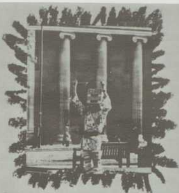
CLIN D'ŒIL ET BOÎTE VIDE: PERFORMANCE/GÉOMÉTRIE COSMOGONIQUE. BIRMINGHAM GRANDE-BRETAGNE 1975.