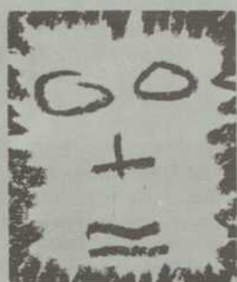
LITTOEL GRINE PIPOLE AS TOTO: DESSIN À LA CIRE (VRAIE GRANDEUR). BELLEVILLE 1980