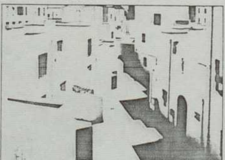
Tunis, un quartier de la Médina

Les auteurs ont cherché à recréer la continuité des anciens axes de circulation et surtout celle des "souks" bordés d'habitat. La volumétrie des bâtiments et la nature de leurs groupements répondent également à la volonté de s'adapter à la morphologie du quartier.