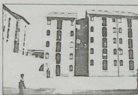
Mexico, quartier de Tepito

La lutte des habitants, appuyée par l'Atelier Populaire d'Urbanisme, a débouché sur l'établissement d'un programme qui renoue avec les principes de rues, de places, d'îlots et de gabarits traditionnellement présents à Roubaix.