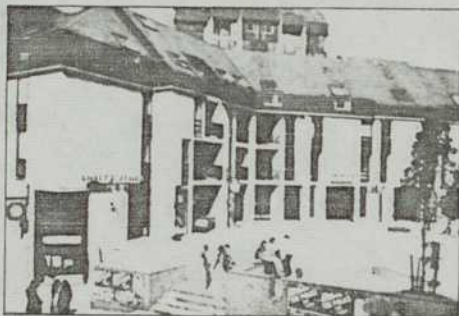
Belgique, Louvain la Neuve

"La confiance en une communauté basée sur les individus fait naître une expression architectonique qui se distingue essentiellement de celle que l'on trouve dans les projets caractérisés par la confiance, aujourd'hui en vogue, en une communauté basée sur des symboles". (Extrait du catalogue).