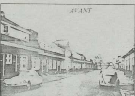
Hollande, aménagements de rues d'habitations

Les auteurs ont cherché à recréer la continuité des anciens axes de circulation et surtout celle des "souks" bordés d'habitat. La volumétrie des bâtiments et la nature de leurs groupements répondent également à la volonté de s'adapter à la morphologie du quartier.