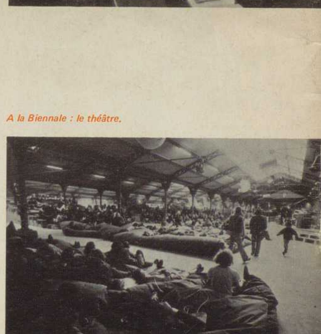
A la Biennale : le théâtre.