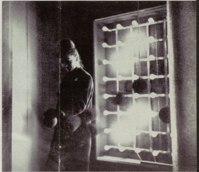
« Le Labyrinthe » (p. 71)