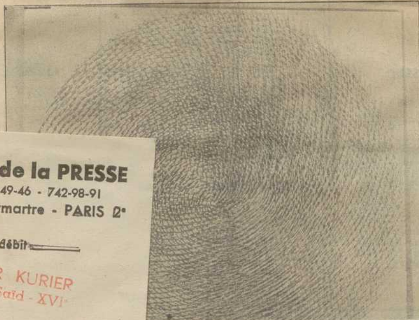
« grande spirale ». (Photo TdL).