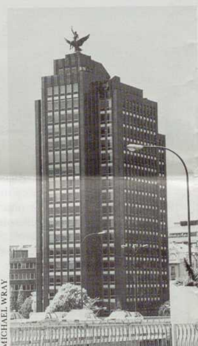
Calle Serrano, quartier des boutiques. Le Palais des Glaces du parc du Retiro.

tères de Madrid se croisent Plaza Cibeles. D'un côté, El Paseo del Prado , de l'autre El Paseo de la Castellana qui mène au Madrid d'aujourd'hui, univers de gratte-ciel dont la perspective conduit à Orense, le quartier des Américains et des Japonais, à base de centres commerciaux, de bars et de piscines... Encore hors circuit, un vieux quartier tout tordu, le Lavapies (lave-pieds) où les voitures ne passent pas, les touristes non plus, mais où quelques bars branchés commencent à s'installer. Sans oublier le dimanche matin, le marché du Rastro , les puces de Madrid, où il faut non seulement regarder mais surtout se montrer à midi.